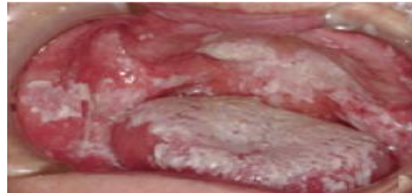
口腔内に繁殖したカンジダ菌

ここで大切なのは、毎日の正しい入れ歯の洗浄です。 普通のブラシでもかまいませんが、入れ歯用の歯ブラシをお使いいただくとより効果的です。 パネの部分は特に義歯ブラシの尖った方が良く磨けます。 ただ、ブラシでこすただけでは入れ歯の細かいデコボコに入り込んだ細菌や食べかすは取り除けません。 かといって、歯磨き粉を付けてごしごし擦るのでは義歯を傷つけてしまいます。そこで有効なのが洗浄剤です！ 夜外した際には洗浄剤に浸けることにより除菌することができます。洗浄剤は週に2～3回使用がおすすめですが、着色などがある場合は毎日使用しましょう。