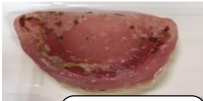
カビの生えた入れ歯

6月に入るとじめじめした梅雨に季節になりますね。湿度が上がると、お風呂や、流し台にカビが生えやすくなります。このカビ実は入れ歯にも生えるのです！！ お口の中にはさまざまな細菌が常にいます。その中にはカビ（カンジダ菌）もいます。常に湿っていてカビにとってはとても居心地のいい環境なのですが、普段は特に悪さはしません。しかし、抵抗力が落ちると白い苔状に表れます。特に入れ歯の表面は眼では見えない細かいデコボコが無数にあります。そこにこのカンジダ菌が入り込み、お手入れを怠ると繁殖してしまいます。 そうした入れ歯をお口に入れておくと、入れ歯と触れている歯ぐきや舌にもカンジダ菌が繁殖してしまい痛みの原因にもなります。